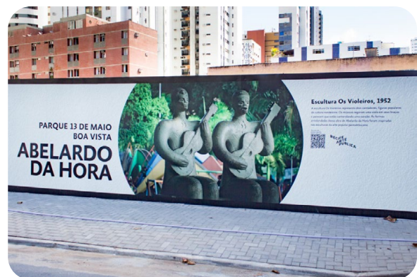
Mural de 200m en PVC Bold